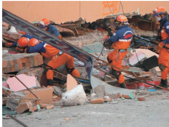
ゴンガブ地区での1階、2階が座屈したホテルにおける高度救助資機材を使用した捜索救助活動 ネパール地震災害（平成27年4月派遣）

ガブ地区等で捜索救助活動を行い、派遣期間は2週間に及んだ。これは、追加派遣を行わないものとしては、過去最長の派遣期間である。