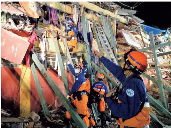
トラルパンでの捜索救助活動 メキシコ地震災害（平成 29 年 9 月派遣）

平成 30 年 2 月に発生した台湾東部での地震災害においては、台湾当局による捜索・救助活動を支援するため、国際緊急援助隊専門家チーム 8 人（うち国際消防救助隊員 2 人）が派遣された。余震が続く中、専門家チームは到着直後から現地救助隊に対し