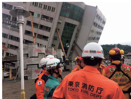
花蓮県で捜索救助活動を支援 台湾東部地震災害（平成 30 年 2 月派遣）

て捜索用資機材の取扱指導や捜索活動の助言を実施した。今回の専門家チーム派遣は、東日本大震災の際に台湾が行った支援に対する日本側の恩返しと受け止められ、台湾で高く評価された。